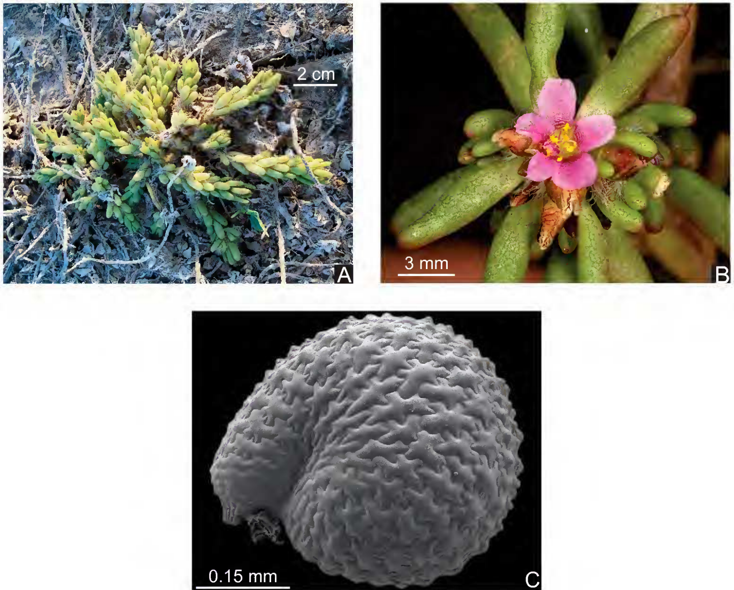
Fig. 2. Portulaca californica . A. aspecto general de la planta; B. flor y cápsulas inmaduras cubiertas por el cáliz; C. imagen de una semilla vista a través del microscopio electrónico de barrido (G. Ocampo y J. T. Columbus 1529).

El taxon se encuentra principalmente cerca de dunas costeras estables o en suelos arenosos adyacentes a las costas con vegetación de matorral sarcocaulé, preferentemente a sotavento, pero también en lugares expuestos directamente a la brisa del mar. En general, la especie se halla en terrenos abiertos, planos o ligeramente inclinados. Entre las especies con las que P. californica se encuentra asociada frecuentemente tenemos a Boerhavia sp., Euphorbia spp., Jouvea pilosa (J. Presl) Scribn., Pectis sp., Trianthema portulacastrum L.